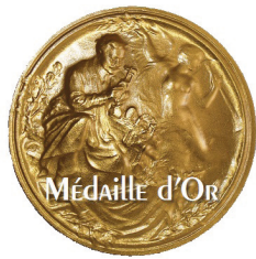
CONCOURS LÉPINE INTERNATIONAL PARIS 2019